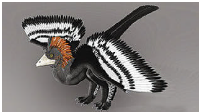
“赫氏近鸟龙”被“复原”后的模拟图。

北京大学、美国耶鲁大学、得克萨斯大学等多家大学、机构的科研人员联合研究显示，远古小型四翼恐龙“赫氏近鸟龙”四翼长着羽毛，黑白相间，与头部红褐色羽冠搭配，外观靓丽。该研究结果 2 月 4 日发表在《科学》杂志网站。